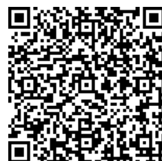
薬剤部ホームページ

部長：いわきで音楽ライブがあると聞きつけ三崎公園へ行った。 いわきというとフラガールのイメージであったので、 新鮮だった。ライブ中演者が、『新型コロナ流行して東京 のライブハウスが使えなくて活動に困って、野外ホールを 探していた時に声をかけていただき、続いている大事なイ ベント』とのMCがあり、いわきの人たちの温かさを感じ ほっこりした。