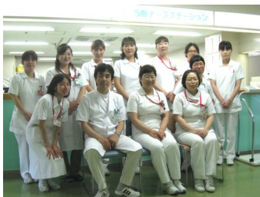
病棟スタッフです

5西病棟は病床数54床。消化器科の病棟です。病棟スタッフは消化器科医師7名、看護師24名、看護助手1名、クラーク1名、薬剤師1名でたぶん(?)院内のどこより平均年齢の若いフレッシュな病棟です！