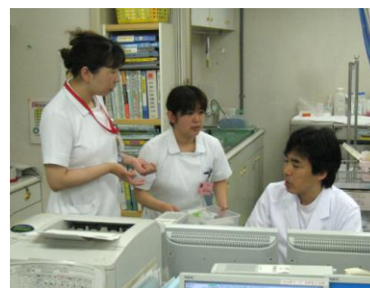
主治医と担当看護師のミーティング中です

1/3は緊急入院の患者様という状況ですが、若さとエネルギーにあふれたスタッフ一同で安心・安全・安楽をモットーに援助しております。入院される患者様ができるだけ安らかに過ごしていただけるように心掛けていますので今後ともよろしくお願いたします。